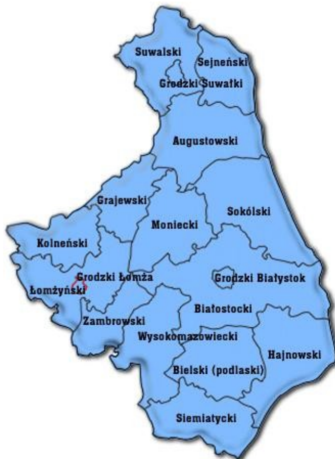
Rysunek 1. Lokalizacja miasta Łomży na tle podziału administracyjnego województwa podlaskiego

Program opracowano dla miasta Łomży, które zlokalizowane jest w północno-wschodniej Polsce, w zachodniej części województwa podlaskiego. Poniżej przedstawiono lokalizację miasta Łomży na tle podziału administracyjnego województwa podlaskiego.