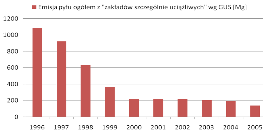
Rysunek 2. Emisja pyłu ogółem z zakładów szczególnie uciążliwych na terenie miasta Łomży.

Według danych GUS od 1996 do 2000 roku obserwowany był silny spadek „emisji zanieczyszczeń pyłowych z zakładów szczególnie uciążliwych” (brak danych o ilości i rodzaju zakładów poddanych badaniu statystycznemu), co związane było z przemianami gospodarczymi zachodzącymi w kraju. W latach 2001 -2005 obserwowano również spadek wielkości emisji zanieczyszczeń pyłowych, jednakże znacznie mniejszy. Emisja zanieczyszczeń pyłowych w 2005 roku z zakładów szczególnie uciążliwych wynosiła wg GUS 138 Mg.