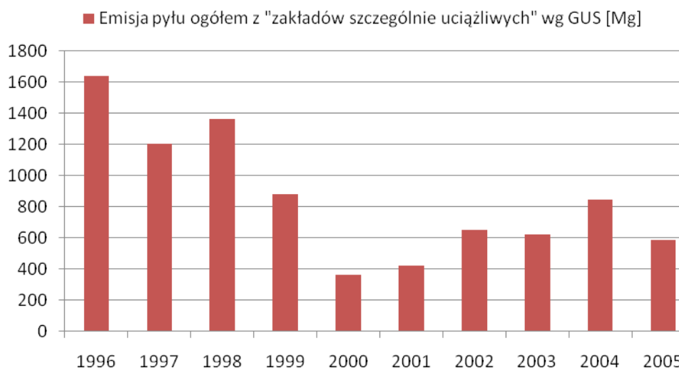
Rysunek 2. Emisja pyłu ogółem z zakładów szczególnie uciążliwych na terenie miasta Białystok.

Według danych GUS od 1996 do 2000 roku obserwowany był silny spadek „emisji zanieczyszczeń pyłowych z zakładów szczególnie uciążliwych” (brak danych o ilości i rodzaju zakładów poddanych badaniu statystycznemu), co związane było z przemianami gospodarczymi zachodzącymi w kraju. W latach 2001 -2004 obserwowany był niewielki wzrost emisji zanieczyszczeń pyłowych, a następnie spadek w 2005 roku. Emisja zanieczyszczeń pyłowych w 2005 roku z zakładów szczególnie uciążliwych wynosiła wg GUS 590 Mg.